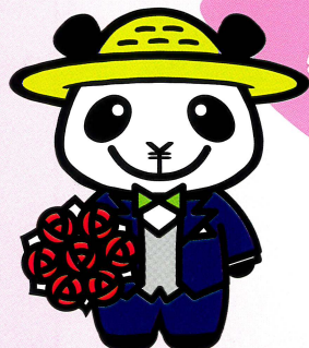
JAバンクえひめキャラクター ばんじゃくん

人生にはさまざまな ライフイベントがあり 意外とお金がかかります! コツコツと月々の 定期積金で安心の生活を おくりましょう!