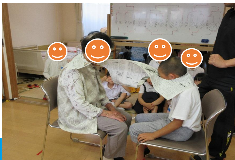
↑「はっけよーい、のこった！」元気な声が響いています。

坂本小学校の子供たちとの交流会を行いました。 利用者さんと子供たちとで新聞相撲をしました。