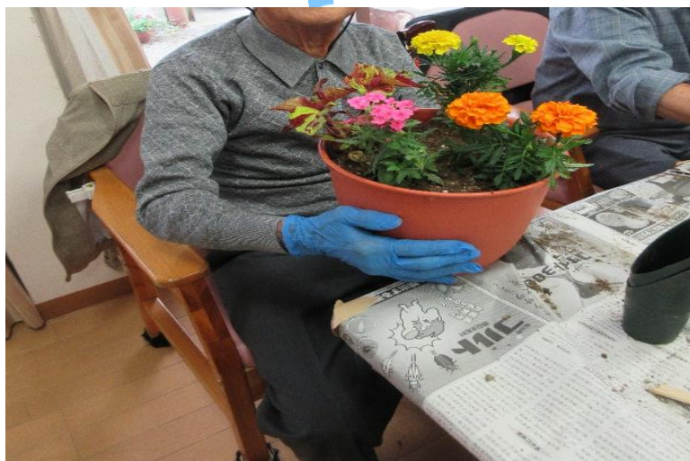
↑綺麗な鉢植えの完成

園芸をはじめました。寄せ植えを行っています。 材料代400円で参加していただけます。