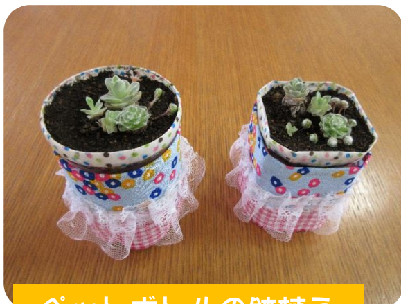
ペットボトルの鉢植え (多肉植物)