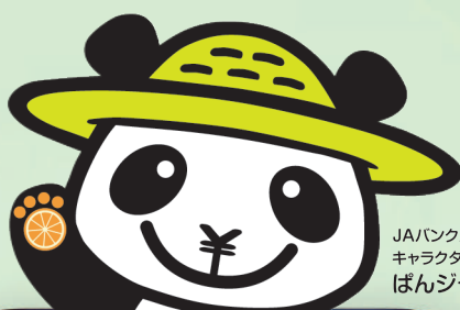
JAバンクえひめ キャラクター ばんじゃくん