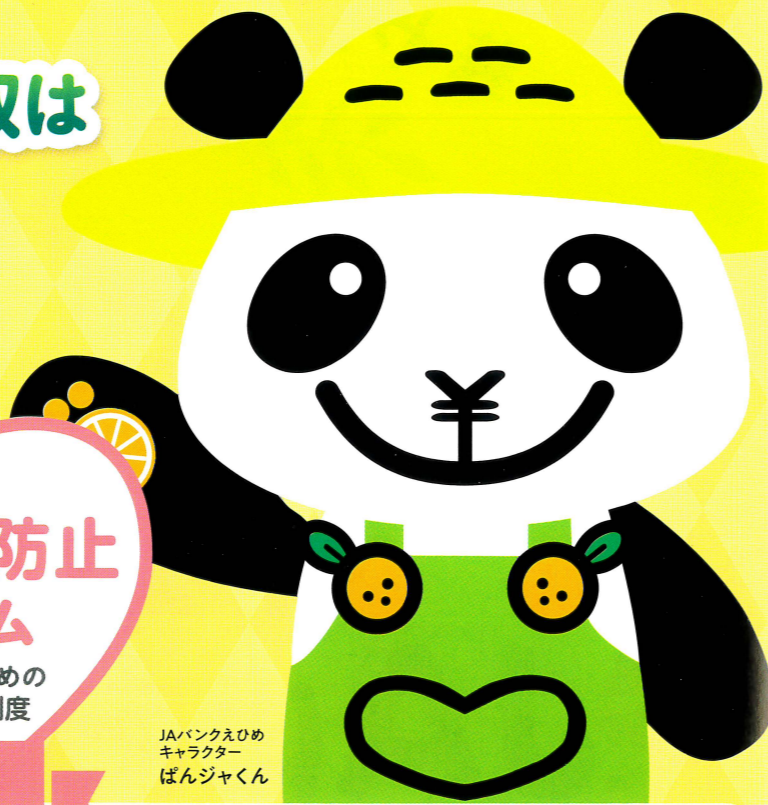
JAバンクえひめ キャラクター ばんじゃくん