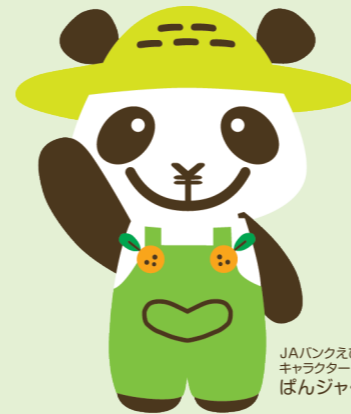
JAバンクえひめ キャラクター ばんじゃくん