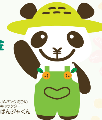
JAバンクえひめキャラクター ぼんジャくん